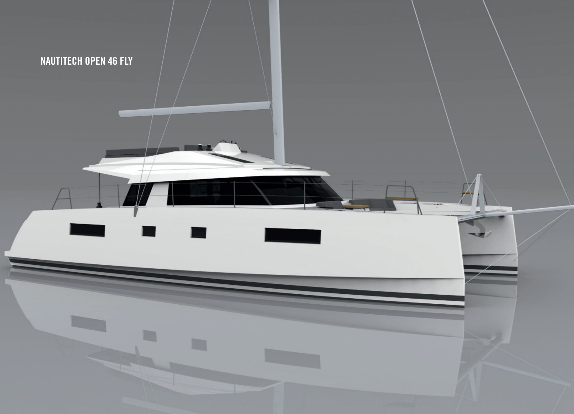
NAUTITECH OPEN 46 FLY